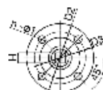
Верхний фланец по ISO 5211